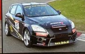
KIA C'EED RACER GEREDEN