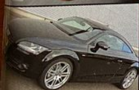
AUDI TT JD BLACK MAGIC