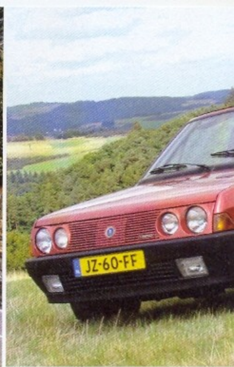
OFFICIEEL GEEN FIAT, MAAR EEN BERTONE RITMO CABRIO EN ZO HET OOK OP HET KENTEKEN. DE CABRIO IS VAN 1983, HET JAAR WAARIN DE GEFACILITE VERStE MET DUBBELE KOPLAMPEN DEBUT