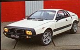
LANCIA MONTECARLO BRULLENDE BASTAARD