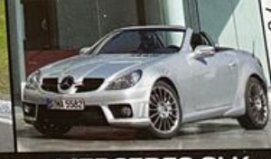
MERCEDES SLK SNUFJE MCLAREN

En verder: Saab 9-5 kopen | Smart Fortwo Brabus | Alfa GT oud-nieuw | Saab Aero XWD 156 GTA - 156 VMR | Maserati Biturbo | Fiat Ritmo fanaat | Corvette C6