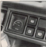
De econometer: nuttig voor wie niet weet wat de rechtervoet doet. Onder: De pechlamp met ingebouwde haspel en voldoende snoer om overal in de motorruimte te komen, aansluiting in de houder van de sigare-aansteker.

Gek genoeg is er één instrument op het dashboard dat het zonder verlichting moet doen. Dat is de econometer, rechts van het contactslot. Die is in donker niet afleesbaar, dus met behulp van dat instrument proberen zuinig te rijden moet maar overdag gebeuren. Geeft niet, want de lol van dat ding is er al lang af. We zijn trouwens blij dat in de Fiat niet van die zenuwachtig, fel oplichtende econolampjes zijn ingebouwd. Nee, die econometer is gewoon een wijzerplaat met een groen, geel en rood vlakje, waarover het wijzerzich-