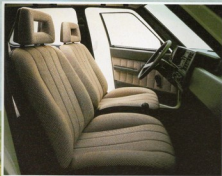
Radio gegen Aufpreis