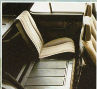
Automatisch geteilt: RUC 1500 gegen Aufpreis