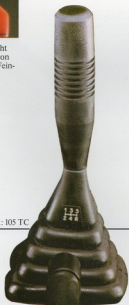
Abb.: 105 TC

◀ übersichtlicher und servicefreundlicher Motorraum mit Ersatzrad (Abb. 105 TC).