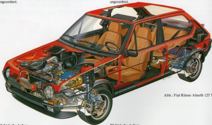
Abb.: Fiat Ritmo Abarth 125 TC

mechanisch, Einscheiben-Trockenkupplung, 5-Gang-Handschaltgetriebe, Vorderradantrieb, Motor quer zur Fahrtrichtung angeordnet.