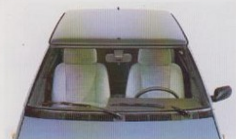
Aerodynamische optimale luchttoevoeropening langs de volle breedte van de voorruit.