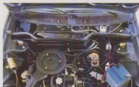
Effektieve isolatie van motorgeluid door dempingsschot en extra tussen- ruimte.

De Ritmo Super biedt werkelijk alles om het autorijden aangenamer, comfortabeler en veiliger te maken.