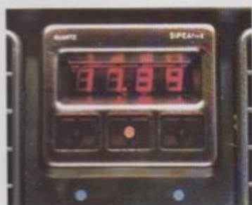
Digitaal kwarts-uurwerk met chromometerfunctie.