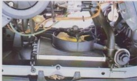
Aluminium radiator: een kostbare maar ideale oplossing voor een lager gewicht en betere warmteafvoer.