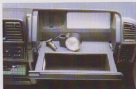
Handschoenenvak met verlichting, make-up spiegel en los te gebruiken lampje.

dat de bestuurder de auto goed in de hand heeft en fit op de plaats van bestemming arriveert. Het dashboard van de Ritmo Super is hypermodern en uitermate compleet uitgerust voor optimale informatie van de bestuurder en het grootst mogelijke aflees- en bedieningsgemak. Behalve een toerenteller en dagteller met nulstelling omvat het dashboard nog een speciaal checkpanel met o.a. aparte waarschuwingslampjes voor remoliepeil en slijtage van de remblokken.