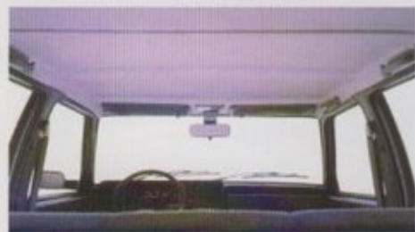
Nieuwe hemelbekleding van geluid-dempend en warmte-isolerend materiaal.