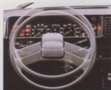
In hoogte verstelbaar stuur.