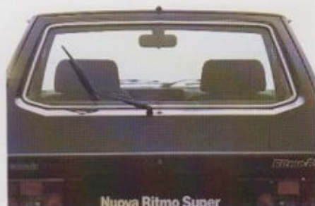
Verwarmde achterraut met wis/was installatie.

dat de bestuurder de auto goed in de hand heeft en fit op de plaats van bestemming arriveert. Het dashboard van de Ritmo Super is hypermodern en uitermate compleet uitgerust voor optimale informatie van de bestuurder en het grootst mogelijke aflees- en bedieningsgemak. Behalve een toerenteller en dagteller met nulstelling omvat het dashboard nog een speciaal checkpanel met o.a. aparte waarschuwingslampjes voor remoliepeil en slijtage van de remblokken.