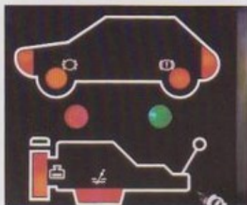
Elektronisch check-panel voor kon- trole van remsysteem, verlichtings- installatie, motorsmering en -koeling.