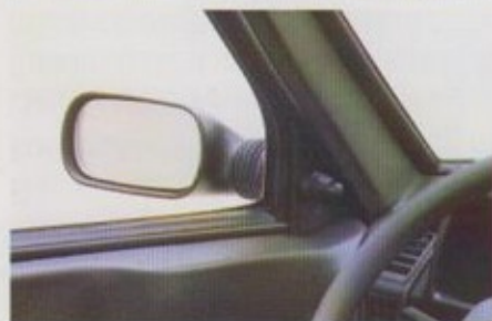
Van binnenuit verstelbare buiten- spiegel links.