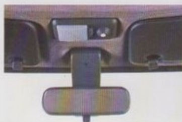
Binnenverlichting met apart verstelbaar kaartleesspotje.