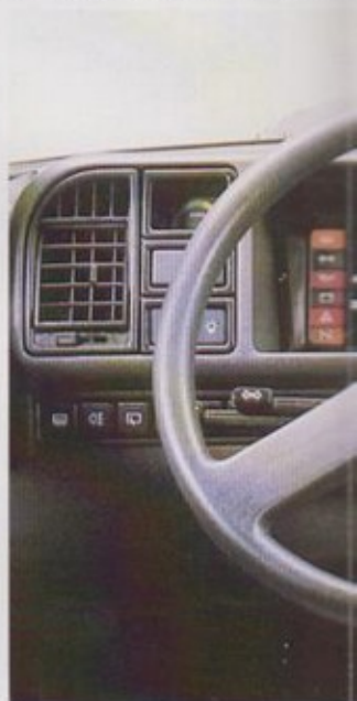
Het moderne, functionele dashboard.