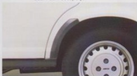
Steenslag-beschermstrips aan de achterwielkasten.